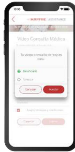
CLIC EN BENEFICIARIO