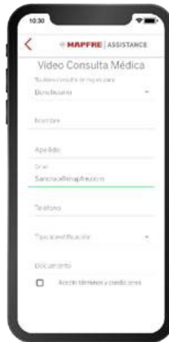
FORMULARIO VIDEO CONSULTA MÉDICA